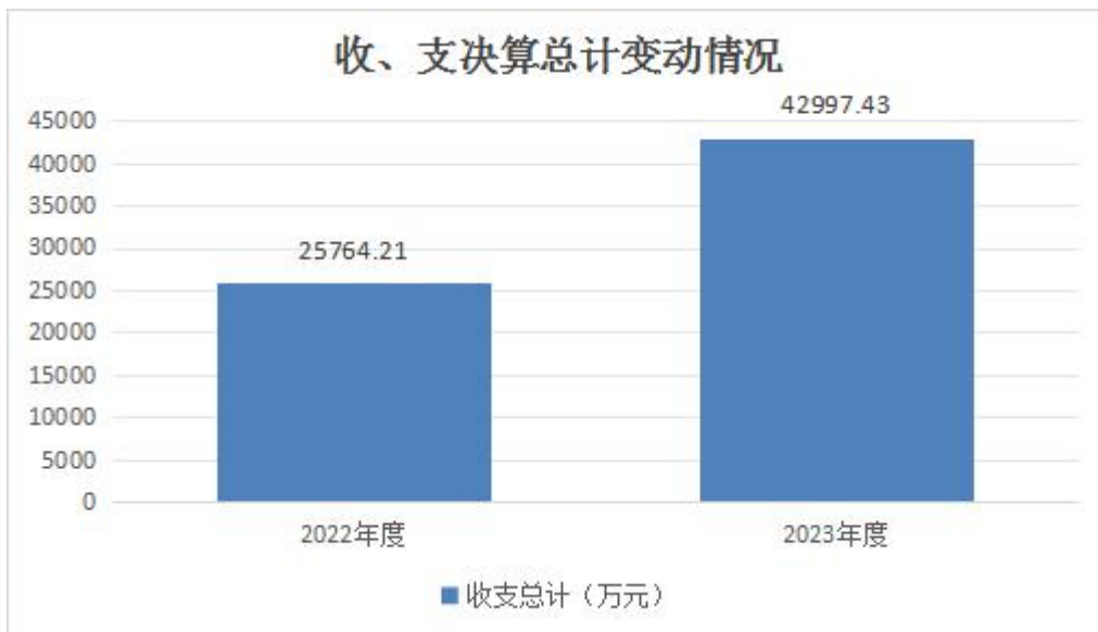
图 1: 收、支决算总计变动情况

2023 年度收、支总计均为 42997.43 万元。与 2022 年度相比，收、支总计各增加 17233.22 万元，增长 66.89%，主要原因是教育项目投入增加，新发行政府专项债用于新建咸宁市职业教育中心。